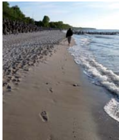
Ein Spaziergang am Meer weckt Glücksgefühle.

Nein, sagt der Dalai Lama. Glück, so das spirituelle Oberhaupt der Tibeter, erfahren wir, wenn wir nach Erkenntnis streben. Glücklich mache uns alles, was negative Geisteszustände überwindet, wie Hass, Wut, Eifersucht. Bei uns Normalsterblichen sind dies vor allem eine erfüllende Arbeit, intakte soziale Bindungen und alles, was die Sinne anspricht: etwa ein Spaziergang am Meer, der verlockende Duft einer Bratwurst oder Musik.