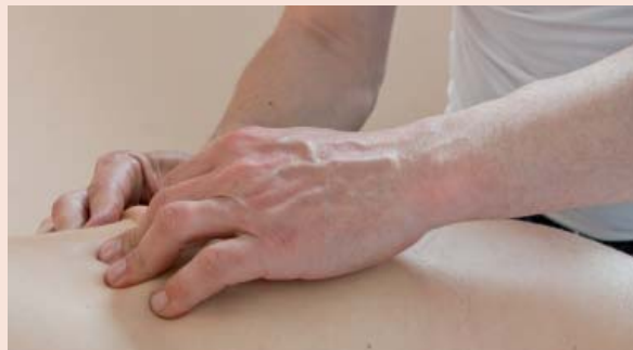
Gelenkblockaden lassen sich häufig durch eine Manuelle Therapie beheben.

Durch vorsichtiges Dehnen wird die Beweglichkeit des betroffenen Bereichs verbessert.