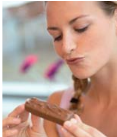
Auch auf Aussehen und Konsistenz kommt es beim Essen an.